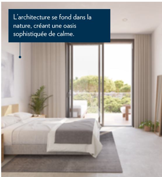
L'architecture se fond dans la nature, créant une oasis sophistiquée de calme.