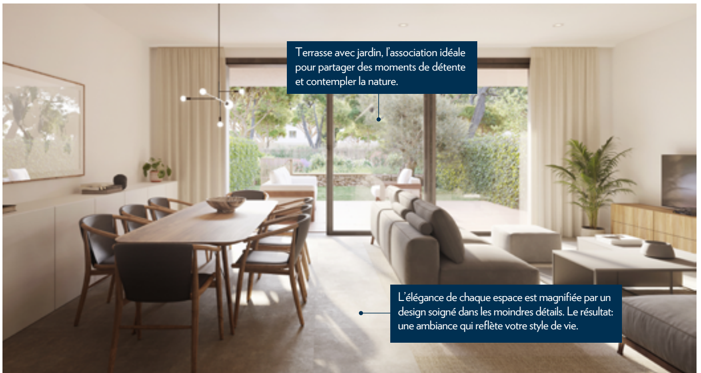
Terrasse avec jardin, l'association idéale pour partager des moments de détente et contempler la nature.