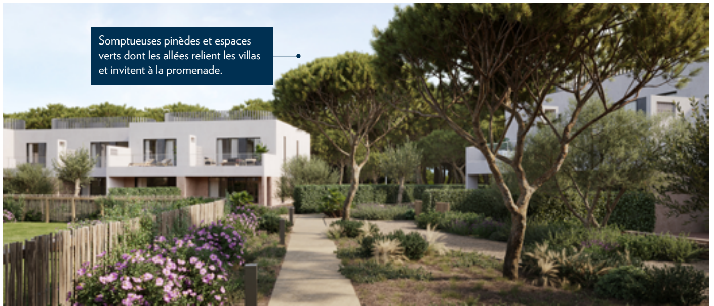
Somptueuses pinèdes et espaces verts dont les allées relient les villas et invitent à la promenade.