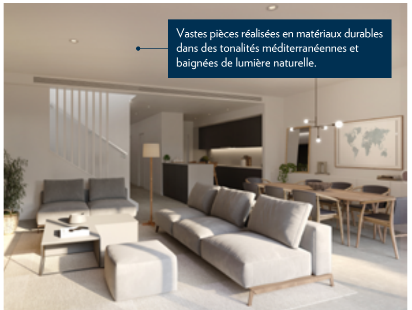
Vastes pièces réalisées en matériaux durables dans des tonalités méditerranéennes et baignées de lumière naturelle.